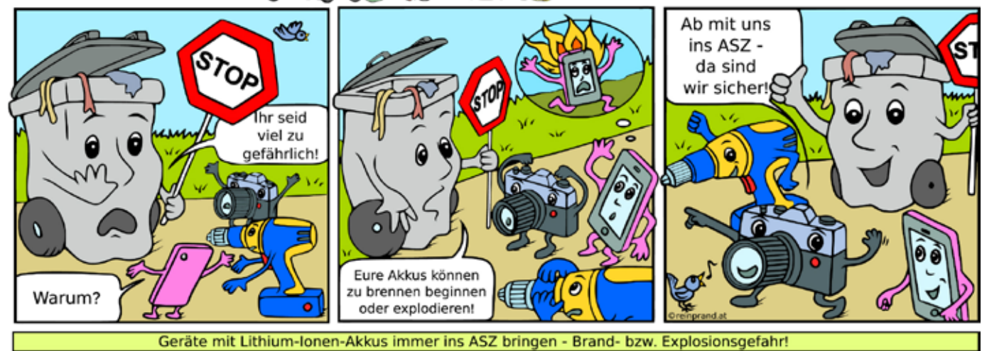
Geräte mit Lithium-Ionen-Akkus immer ins ASZ bringen - Brand- bzw. Explosionsgefahr!