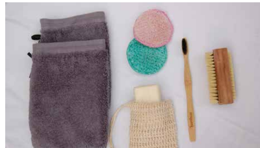
Im Badezimmer gibt es zahlreiche Möglichkeiten, Plastik zu reduzieren.

Das sehr ergiebige Seifenstück für die tägliche Haarwäsche hält sehr lange.