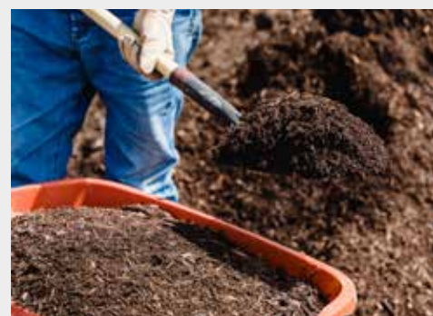
Im ALZ Waldviertel ist wieder Kompost erhältlich.

3751 Rodingersdorf, Lagerhausplatz 1A: Montag bis Freitag: 07.00 – 16.30 Uhr jeden 1. Samstag im Monat: 09.00 – 11.30 Uhr € 26,40 inkl. MwSt. / 1.000 kg